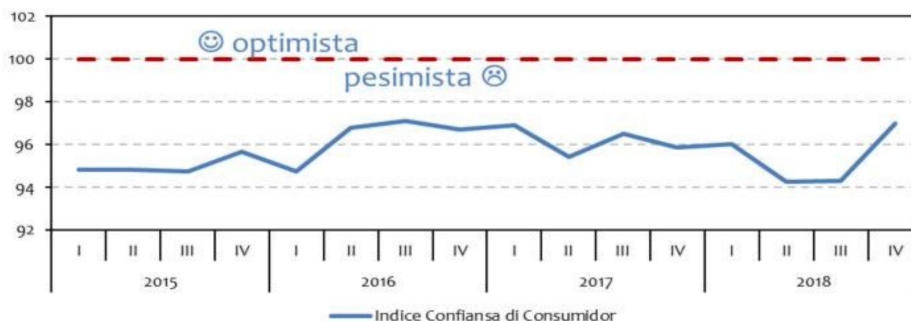
Grafiek 1: Indice Confiansa di Consumidor

Sentimento di consumidor a mehora den e ultimo trimester di 2018, resultando den un Indice di Confiansa di Consumidor di 97,0, un aumento di 2,7 punto di indice compara cu e periodo anterior, segun e ultimo resultadonan di e Encuesta di Confiansa di Consumider (CCS) 2 di Banco Central di Aruba (Grafiek 1) 3 .